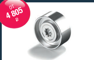
Оригинальный ролик натяжителя MAN