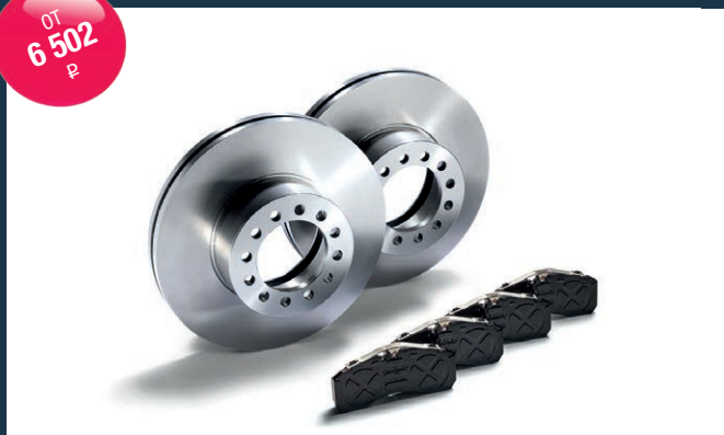
Оригинальные тормозные диски и колодки MAN