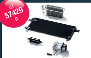
Оригинальные запасные части для системы охлаждения MAN