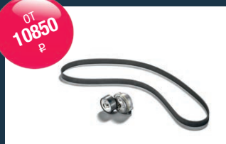
Оригинальный комплект натяжителя ремня MAN

Акция действует с 01.04.2017 по 30.06.2017 г.