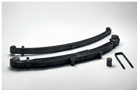
Оригинальные рессоры MAN