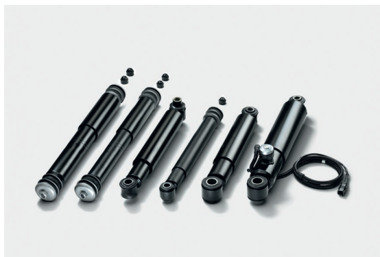
Оригинальные амортизаторы MAN

Успейте купить необходимые детали по выгодным ценам в период подготовки к зиме.