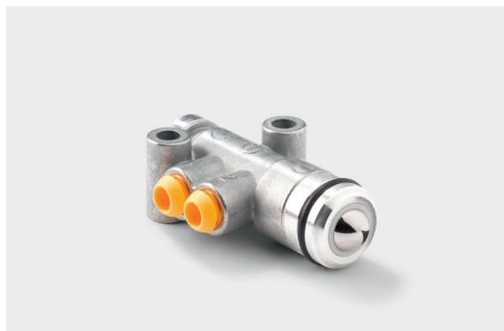
Измерительные устройства MAN