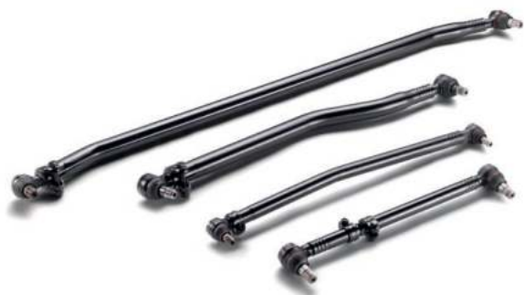
Оригинальные рулевые тяги MAN от 13 700 руб.